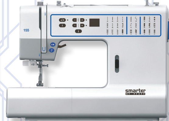
SMARTER BY PFAFF™ 155

Nur für kurze Zeit! Exklusiv im PFAFF® Fachhandel.