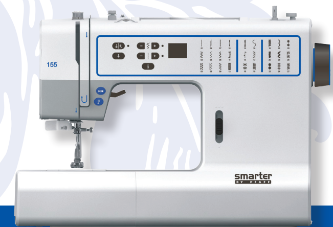
SMARTER BY PFAFF™ 155