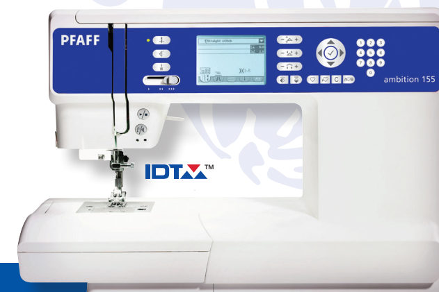
PFAFF® ambition™ 155