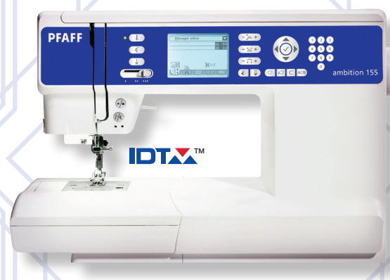
PFAFF® ambition™ 155

Wir feiern! Exklusiv zum 155-jährigen Geburtstag von PFAFF haben wir zwei leistungsstarke, exklusive Modelle für Sie designt. Die PFAFF® ambition™ 155 und die SMARTER BY PFAFF® 155. Dazu schenken wir Ihnen zwei Nähfüße: Den Kräuselfuß und den Paspelfuß, diese finden Sie im Lieferumfang! Wir wünschen Ihnen weiterhin viel Freude und Leidenschaft beim Nähen.