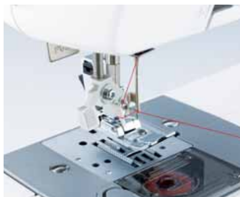
Einfaches automatisches Einfädeln