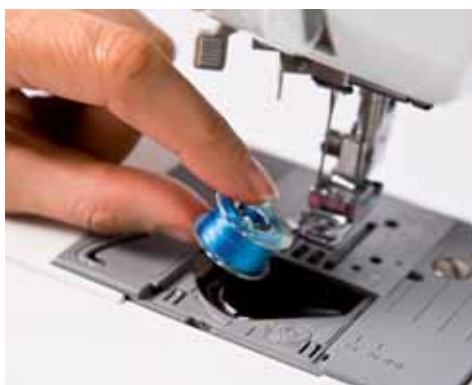
Einfach eine volle Spule einsetzen, schon sind Sie startbereit