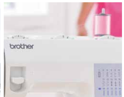
Stichlänge + Stichbreite einstellbar

Weitere Informationen erhalten Sie bei Ihrem Fachhändler oder unter www.brothersewing.eu .